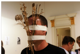
El hombre que quería ser poema, 2012. Centre de Lectura. Reus.

El ámbito en el que trabajo es la poesía experimental y, al igual que en la poesía visual y objetual, que también cultivo, en la acción poética todo es susceptible de convertirse en concepto, en símbolo o en palabra, en signo.