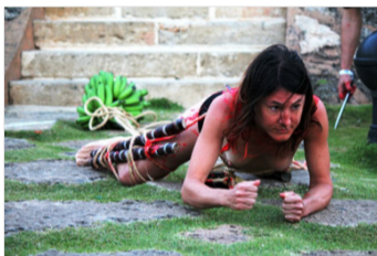
Fort San Felipe, 2013 Puerto Plata. República Dominicana.

¿De qué manera una condición o experiencia personal, como una enfermedad mental, interactúa con la estigmatización comercial y social del entorno?